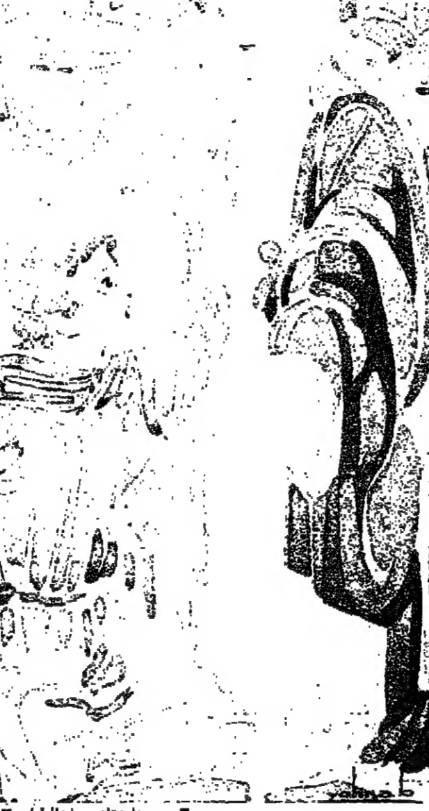
رسم زهرا روحانية الايمان